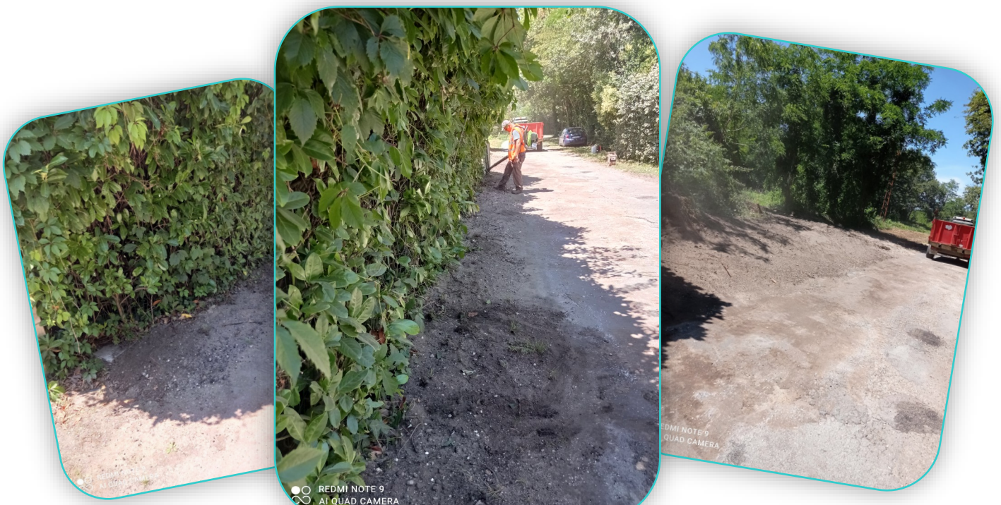
Création d'un système d'évacuation des eaux de pluie Chemin du Soc