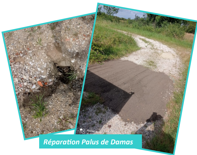
Réparation Palus de Damas