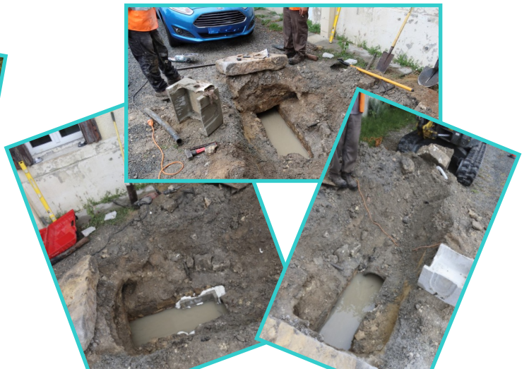
Réparation conduite d'eau pluviale Chemin de Picon